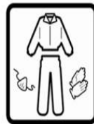
Cover exposed skin. When working in unventilated area wear disposable face mask