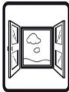
Ventilate working area if possible

“The mechanical effect of fibres in contact with skin may cause temporary itching”